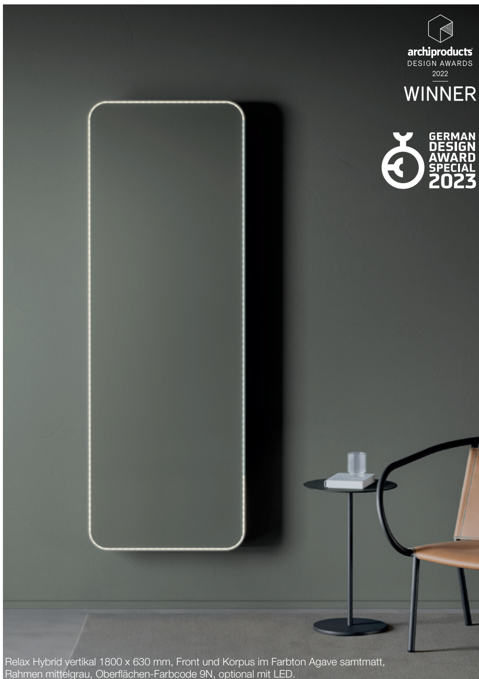
Relax Hybrid vertikal 1800 x 630 mm, Front und Korpus im Farbton Agave samtmatt, Rahmen mittelgrau, Oberflächen-Farbcode 9N, optional mit LED.