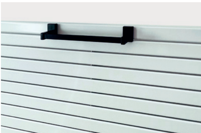
Magnet-Handtuchhalter universal (Art.-Nr. ZAXMHT4K1) im Farbton Schwarz samtmatt (Nr. K1). Hier am Piano 2 H 568 x 1520 mm im Farbton Weiß RAL 9016 (Nr. SW).