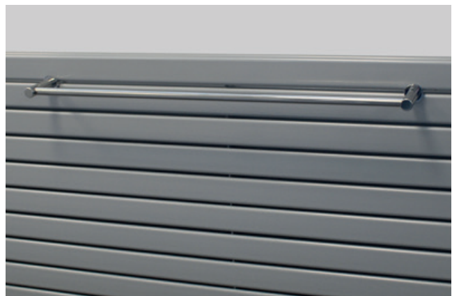
Handtuchhalter Universal, verchromt (Art.-Nr. ZAXH7HCR). Hier am Piano 2 H 568 x 1520 mm im Farbton Titangraumetallic RAL 9023 (Nr. L3).