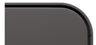
Mittelgrau perl matt Code 4D