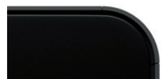
Schwarzperl matt Code 30