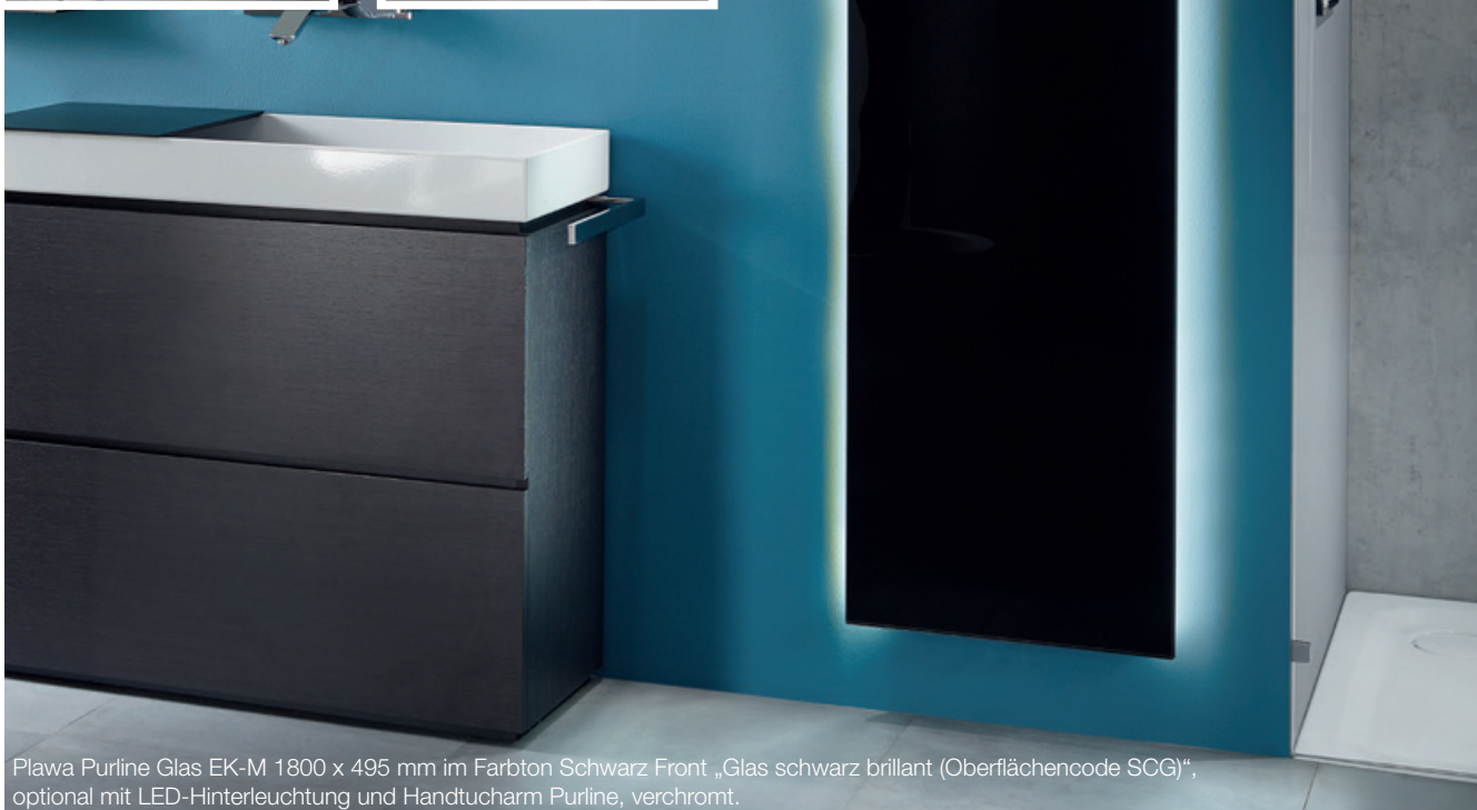
Plawa Purline Glas EK-M 1800 x 495 mm im Farbton Schwarz Front „Glas schwarz brillant (Oberflächencode SCG)“, optional mit LED-Hinterleuchtung und Handtucharm Purline, verchromt.