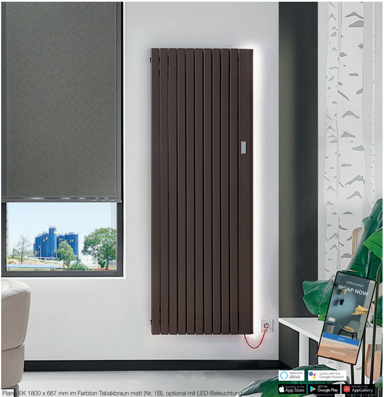
Piano EK 1800 x 667 mm im Farbton Tabakbraun matt (Nr. 1B), optional mit LED-Beleuchtung