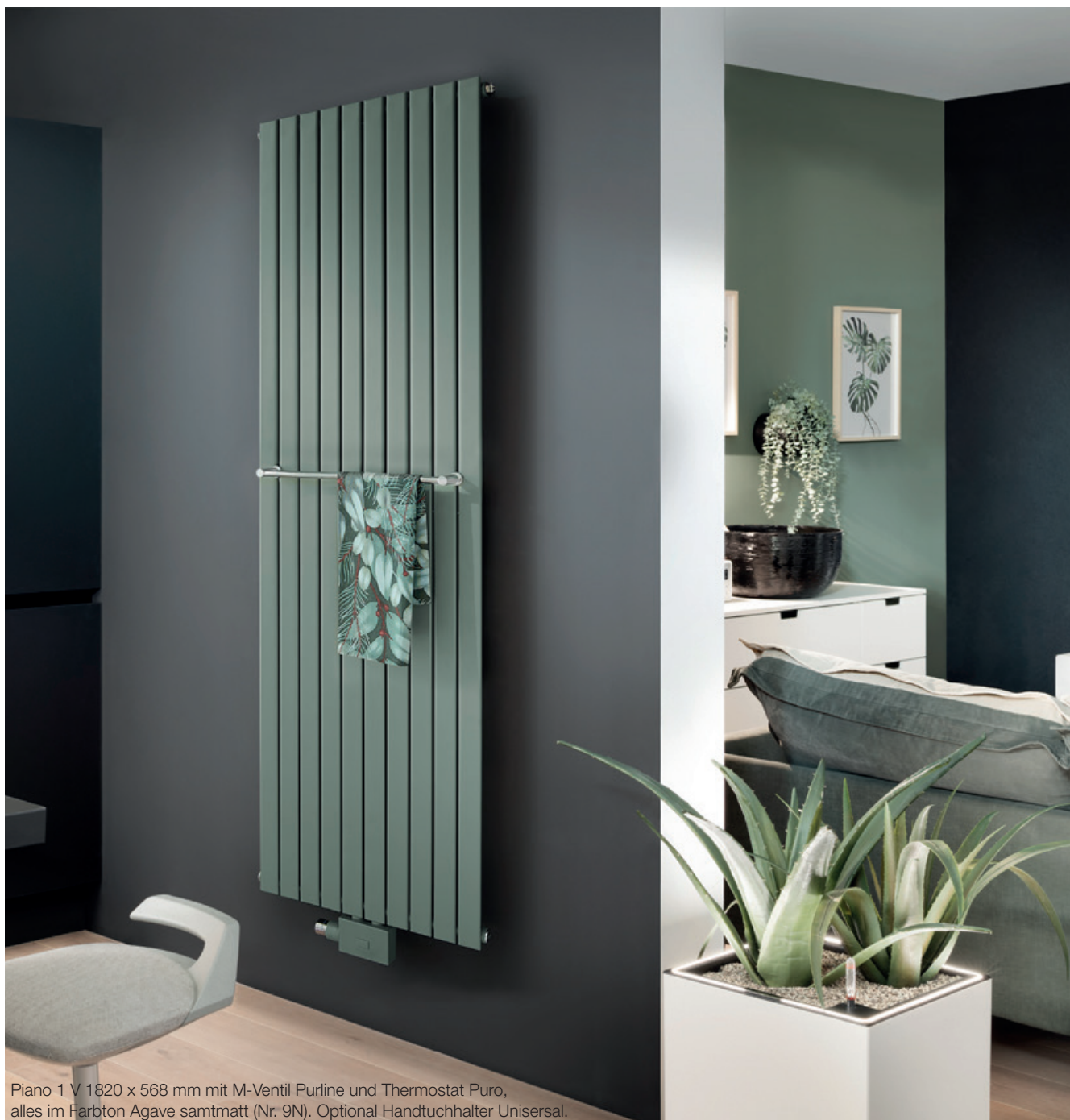
Piano 1 V 1820 x 568 mm mit M-Ventil Purline und Thermostat Puro, alles im Farbton Agave samtmatt (Nr. 9N). Optional Handtuchhalter Unisersal.

BEMM Piano ist eine perfekte Mischung aus Klasse, Eleganz und Linearität. Die vor und hinter den Sammelrohren positionierten abgerundeten Flachpanelrohre ergeben ein ebenmäßiges Design. Aufgelockert durch die feinen Schlitze zwischen den Rohren.