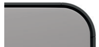
Lichtgrau samtmatt Code 8N