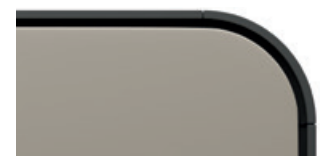
Sand perl matt Code Y4