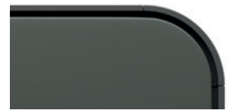
Agave samtmatt Code 9N