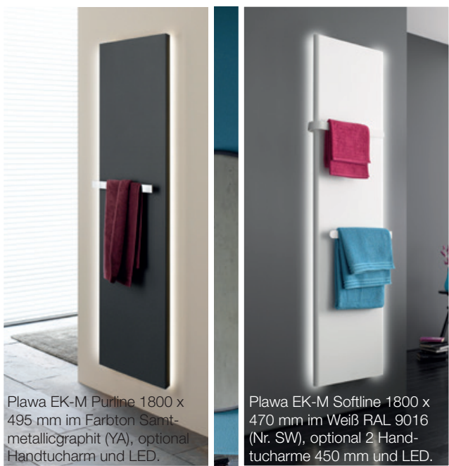
Plawa EK-M Purline 1800 x 495 mm im Farbton Samt-metallicgraphit (YA), optional Handtucharm und LED.