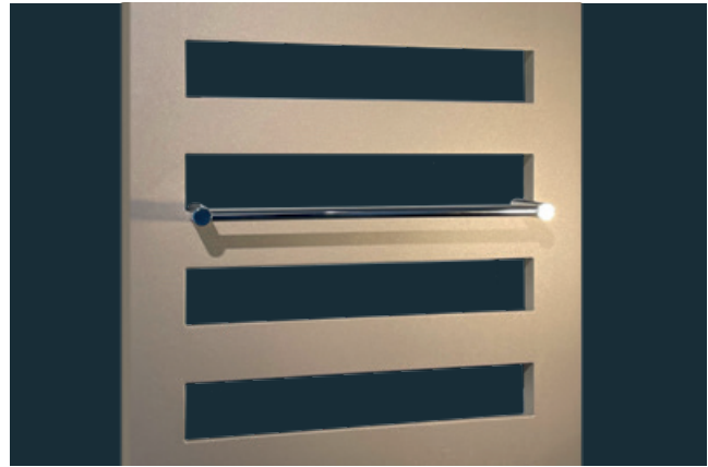
Handtuchhalter Universal, verchromt (Art.-Nr. ZAXH7HCR). Hier am Ceroc 1890 x 600 mm im Farbton Steinbeige perl matt (Nr. 2D).