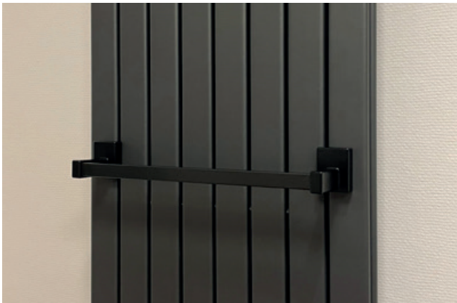
Magnet-Handtuchhalter universal (Art.-Nr. ZAXMHT4K1) im Farbton Schwarz samtmatt (Nr. K1). Hier am Piano 2 V 456 x 1820 mm im Farbton Samtmetallicgraphit (Nr. YA).