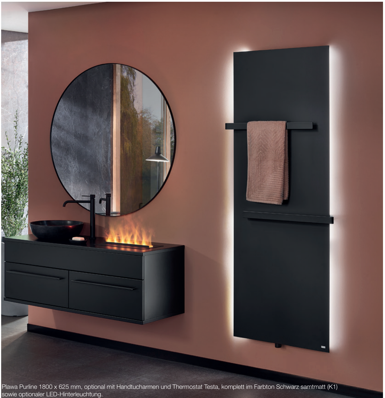
Plawa Purline 1800 x 625 mm, optional mit Handtucharmen und Thermostat Testa, komplett im Farbton Schwarz samtmatt (K1) sowie optionaler LED-Hinterleuchtung.

BLACK IS BEAUTIFUL by BEMM - Mit schwarzen Oberflächen setzen Sie edle Akzente im Badezimmer. Trendige Badeinrichtungen und Armaturen werden mit Heizkörpern in „Schwarz samtmatt“ perfekt ergänzt.