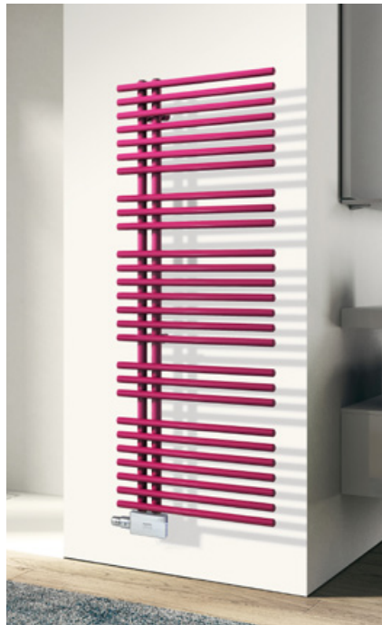
BEMM Asymo 1347 x 600 mm im Sonderfarbton Verkehrspurpur RAL 4006 mit M-Ventil Purline in Chrom.

Asymo sind für Zentralheizungsbetrieb, in bivalenter und in rein-elektrischer (Asymo E) Ausführung gemäß BEMM-Farbpalette lieferbar.