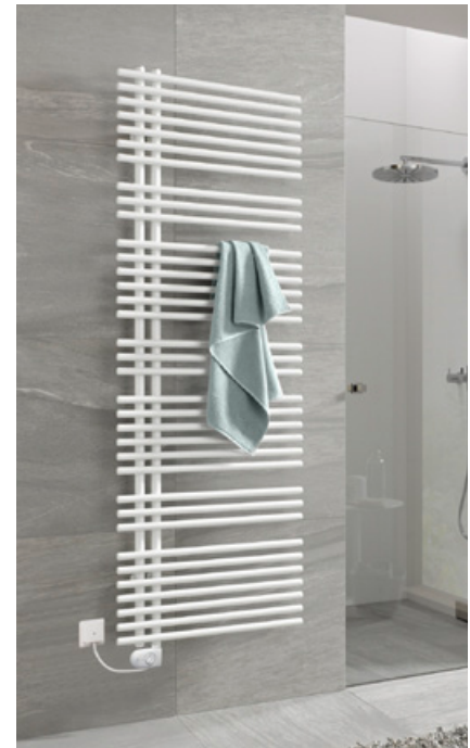
BEMM Asymo EK 1777 x 600 mm im Farbton Weiß RAL 9016 montiert mit Elektro-Heizstab und bauseitiger Wandanschlussdose.