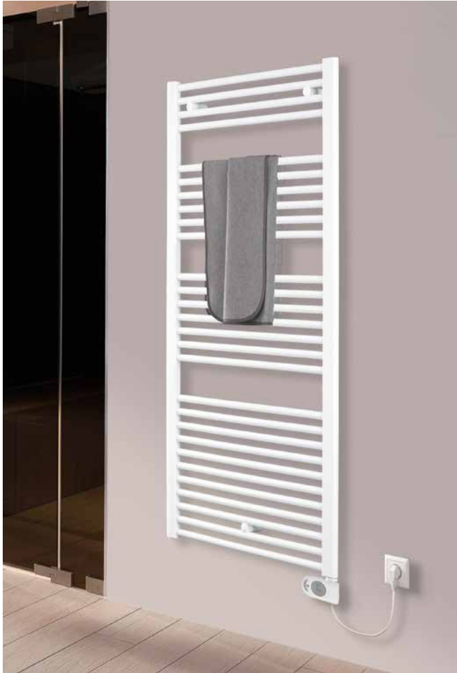
Ares EK-R 1462 x 580 mm im Farbton Weiß RAL 9016 montiert mit Elektro-Heizstab rechts und an Steckdose angeschlossen.