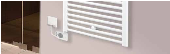
Alternativ Ares EK-R montiert mit Elektro-Heizstab links und bauseitiger Wandanschlussdose.