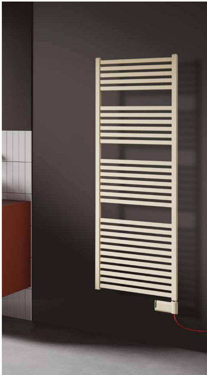
Mido Q NOW EK 1517 x 530 mm mit komplett werksmontiertem WiFi-Elektroheizstab NOW, alles im Farbton Hellelfenbein perlmat (Nr. 1C).