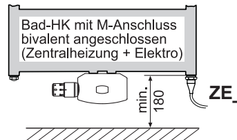
Elektro-Heizstab alternativ rechts oder links montierbar