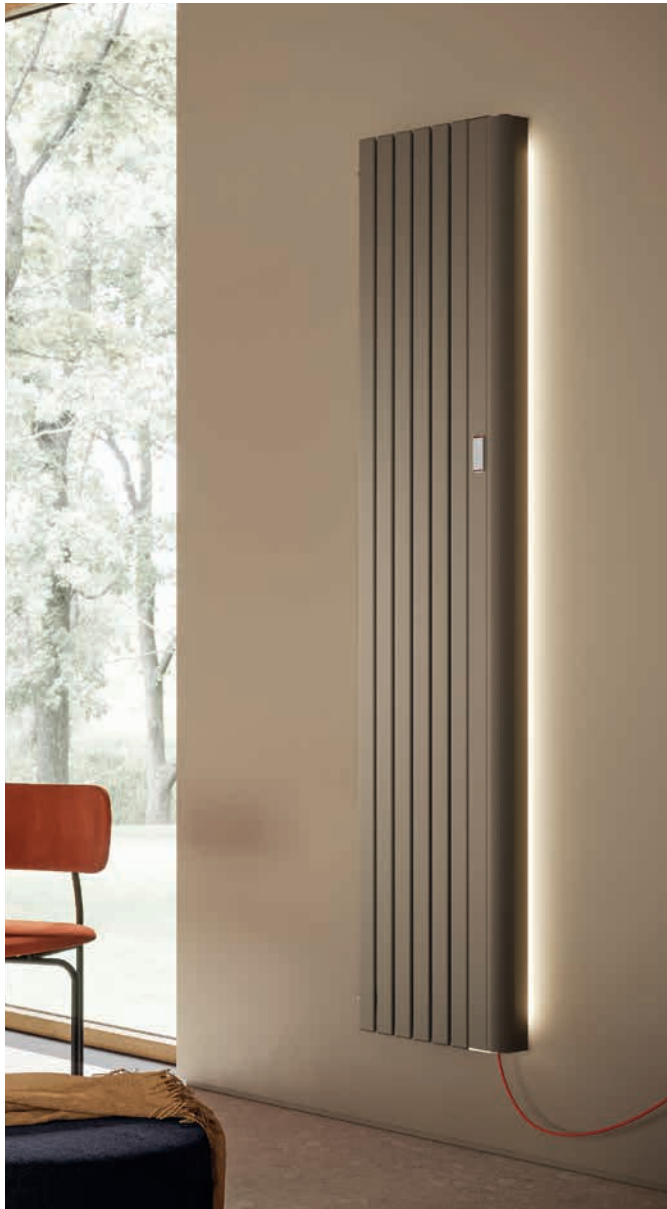
Piano EK 1800 x 667 mm mit LED-Beleuchtung im Farbton Steinbeige perl matt (Nr. 2D).