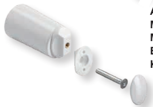
Ares EK Mido Mido CR BMS Kart Plus 1

Befestigungszubehör Ares EK, Mido, Serie BMS und Kart Plus 1 im Blister verpackt: Entlüftungstopfen DN 15 (1/2") und Blindstopfen DN 15 (1/2") in vernickelter Ausführung mit O-Ring, 3 Spezial-Wandbefestigungselemente, tiefenverstellbar, 3 Sechskant-Holzschrauben mit Dübel, Montageanleitung.