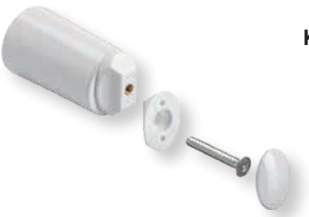
Kart Plus 2

Befestigungszubehör Kart Plus 2 im Blister verpackt: Entlüftungstopfen DN 15 (1/2") und Blindstopfen DN 15 (1/2") in vernickelter Ausführung mit O-Ring, 4 Spezial-Wandbefestigungselemente, tiefenverstellbar, 4 Sechskant-Holzschrauben mit Dübel, Montageanleitung.