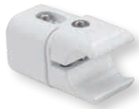
Rondo S Rondo V

Befestigungszubehör Rondo S und Rondo V im Blister verpackt: 2 stabile, montagefreundliche Befestigungen aus Aluminium-Druckguß, tiefenverstellbar, 2 Sechskant-Holzschrauben, 2 Dübel sowie 1 Klemmhalter mit Distanzschraube, Montageanleitung.