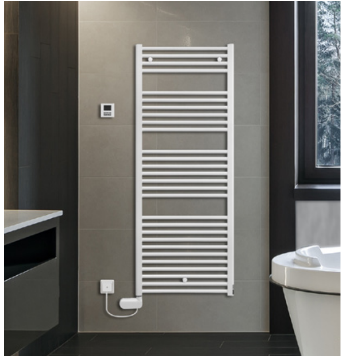
Funk-Uhrenraumthermostat an beliebiger Stelle am Heizkörper oder der Wand montierbar. Anschlussbeispiel mit gekürztem Kabel und Anschluss über Kabelauslassdose.

Heizstab inklusive Schaltgehäuse ist serienmäßig im rechten Sammelrohr montiert. Nicht genutzte Anschlüsse mit Blindstopfen DN15(1/2") mit Innensechskant wasserdicht verschlossen.