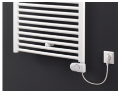
Ares EK montiert mit Elektro-Heizstab rechts und an Steckdose angeschlossen.

Die Medientemperaturregelung ermöglicht eine von der Raumtemperatur unabhängige Einstellung der Oberflächentemperatur des Heizkörpers. In der Regel ist dies eine individuell gewählte Temperatur zur Erwärmung oder Trocknung von Textilien (Handtüchern). ARES EK ist die ideale Ergänzung für eine Fußbodenheizung, da ein Medium- und kein Raumtemperaturregler vorhanden ist. Für die Nutzung als Elektro-Einzelraumheizgerät bitte Variante ARES-RFD EK mit Raumtemperaturregler verwenden (siehe auch Ökodesignrichtlinie ab 01.01.2018).